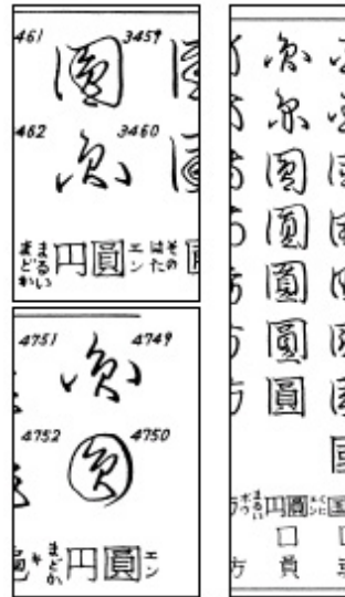
図2 『くずし字解読辞典』の異体字